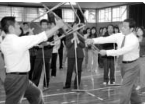
11月7日に浜の宮中学校で行われた防犯教室。

安全で安心して暮らせるまちづくりには、みんなが防犯意識を高め、自分たちの住む地域を見守る「地域の目」を欠かさないこと、そして、防犯活動を継続することが大切です。一人ひとりができることから取り組みを始めましょう。