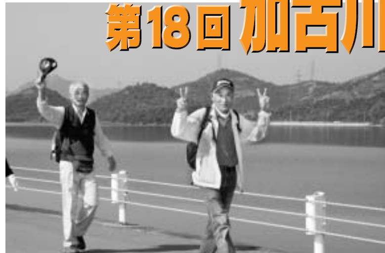
平荘湖の風が、気持ちいいねえ。