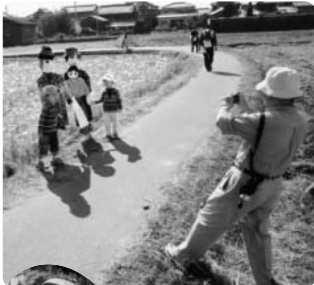
おじいちゃん、かっこよく撮ってね。

「第十八回加古川ツーデーマーチ」が十一月十日、十一日に行われました。二日間で、のべ九千八百十五人のウォーカーが全国から参加し、秋の加古川を歩きました。 このページでは、みなさんの笑顔であふれた二日間を写真で振り返ります。