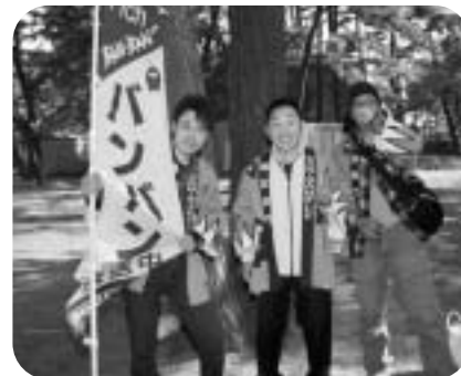
テレビラジオも生放送中！！ イエーイ！ 水管橋を渡ったよ！