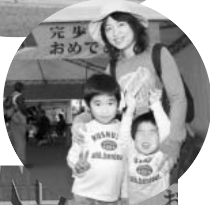
やったあ！ かんぽできたあ！