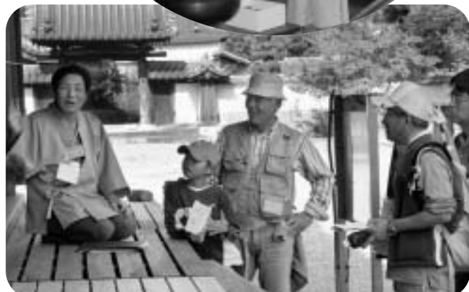
ガイドボランティアも大活躍！（鶴林寺）