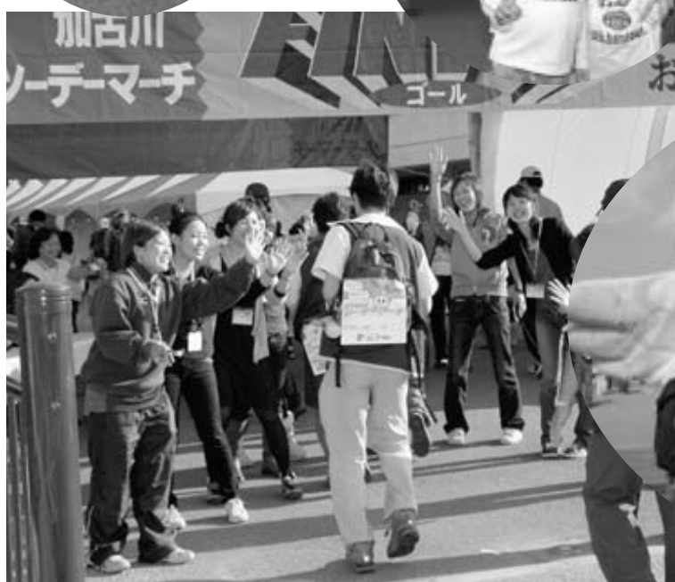
お疲れさま～！ 笑顔とハイタッチでお出迎え。