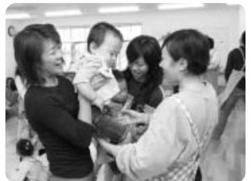
「おめでとうでしたよ」「ありがとう」とお互い笑顔がこぼれるお迎えタイム。彼女らはオムツ替えにも初挑戦していました。

ゆったりと過ごせたのでしょうか。親たちの表情はとても穏やかです。後で聞いた「ゆっくりラーメンが食