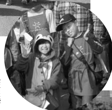
松にまたがり、 はいチーズ！