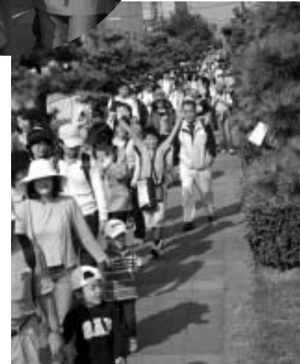
いい天気やな～、もりもり歩くぞ～。（松風こみち）