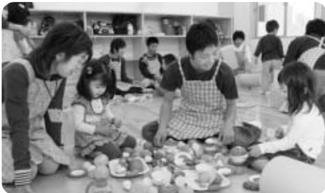
当日8人の男子学生が参加しました。優しい言葉をかけ、子どもを見守る姿に感動。絵本の読み聞かせも上手です。現役パパ、負けてはいられませんよ!

わえないゆっくりした「時間」を過ごすというものです。そこで、私も託児に参加させてもらうことにしました。