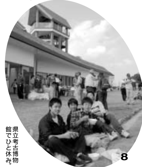
県立考古博物館 でひと休み