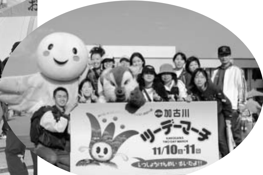
来年もまた、みんなで歩くぞー。