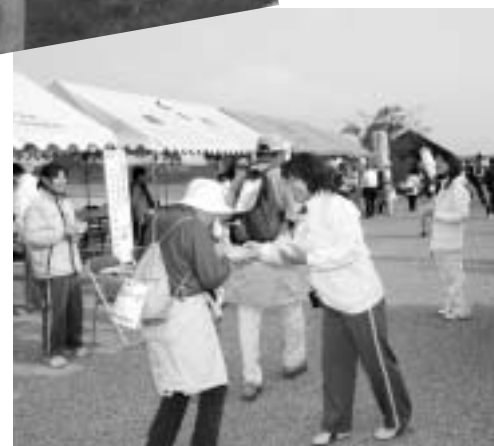
稲美名産「はったいあめ」をどうぞ。（加古大池）