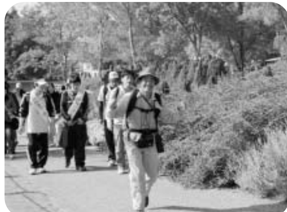
ハーブの香りで元気満タン！（ウェルネスパーク）